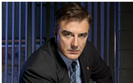
Detective Mike Logan (Chris Noth) gesprochen von Thomas Vogt.

nauer ansieht, dann ist die deutsche Fernsehwelt eigentlich so, wie sie schon immer war: Die eine Serie verschwindet, neue kommen hinzu. So hat zum Beispiel die Serie Scrubs den Autorenstreik schadlos überlebt, nach der 8. Staffel, die eigentlich als finale geplant war, folgt nun sogar eine 9. Und auch Desperate Housewives bekommt eine neue, die 5. Staffel, bei der die Autoren wieder emsig daran arbeiten, den Protagonistinnen neue Männer zuzuschancen. Schon 2007 sprach man von insgesamt 7 Staffeln, die bis mindestens 2011 produziert werden. Die Verträge mit den Hauptdarstellern seien längst unterschrieben. Und erst dann werden wohl endgültig die Bürgersteige in Fairview hochgeklappt. Na mal sehen.